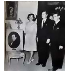
El Presidente López Mateos con John F. Kennedy y Jackie Kennedy en México, junio 26 de 1962

En lo que se refiere a su política exterior las relaciones con E. U. siguieron siendo cordiales aunque México nunca rompió relaciones diplomáticas con Fidel Castro y una muestra de ello es que el presidente Kennedy visitó nuestro país, así como la devolución del territorio El Chamizal en 1964. El apoyo de Estados Unidos fue de significativa importancia en el desarrollo de la política estabilizadora, la cual, se consolidó en este sexenio mediante la adquisición de créditos con lo que impulsó la Alianza para el Progreso, el financiamiento público lo que creó una nueva forma de dependencia. Por otra parte este presidente se interesó en difundir la imagen y posición política de México hacia otros países mediante sus viajes promoviendo su política de paz y desarme, estrechando vínculos de amistad con otras naciones, la visita de diferentes mandatarios y diplomáticos a México y el otorgamiento de ser sede de los Juegos Olímpicos para el 68 y el mundial de fútbol del 70.