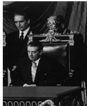
En 1961 la Cámara de Diputados aplicó un impuesto llamado "Tenencia Vehicular" con el fin de construir las instalaciones olímpicas, pues México buscaba ser sede de las XIX Olimpiadas.